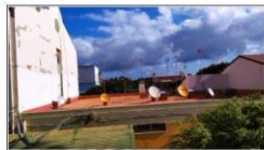
Detalle cubierta parte superior